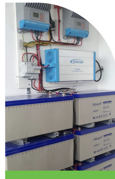
Inversor DC/AC Regulador de carga Baterias